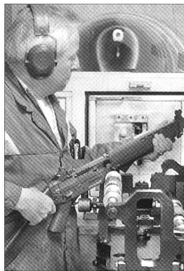
Truppenferne Instandhaltung: wird durch die stationäre Logistik der Logistikbasis der Armee (LBA) oder in der Industrie erbracht.

Verantwortlich für die Ausbildung der Truppenhandwerker