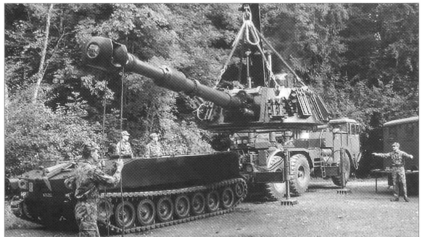
Truppennahe Instandhaltung: Der Truppenhandwerker ist für den Erhalt einer hohen Verfügbarkeit des Systems verantwortlich.