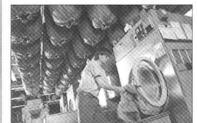
Die moderne Instandhaltung der Schweizer Armee hat ein Ziel: eine hohe Wirtschaftlichkeit von Systemen.

Diesen Zielen kann entnommen werden, in welche Richtung sich die Massnahmen zur Optimierung der Instandhaltung und damit verbunden der Kostenreduktion entwickeln werden. An diese notwendige Optimierung haben von der Industrie bis zum Truppenhandwerker alle Instandhaltungspartner namhafte Beiträge zu liefern.