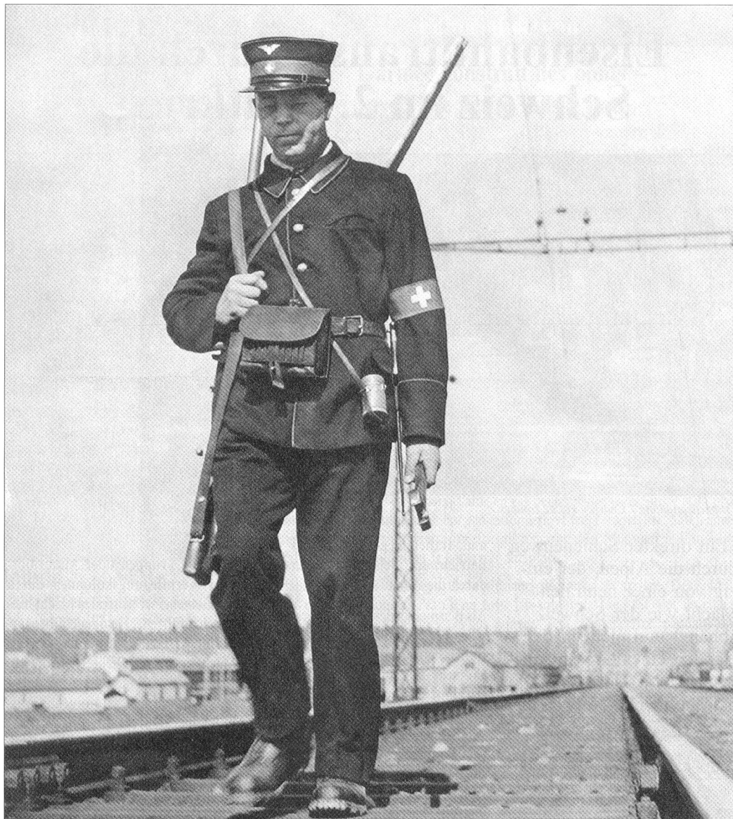
Bewaffneter Streckenwärter. / Garde-voie armé en patrouille.

Neben dem innerschweizerischen Personenverkehr, welcher als Folge des faktischen Transportmonopols der Eisenbahnen im 2. Weltkrieg zunimmt, haben die Bahnen auch die erheblichen Militär- und Kriegswirtschaftstransporte zu bewältigen. Damit nicht genug, setzt doch bei Kriegsbeginn ein umfangreicher Transitverkehr zwischen Deutschland und Italien ein, der bevorzugt über die kürzeste Distanz, das heisst über die schweizerischen Alpenbahnen geführt wird. Durch die englische Seeblockade im März 1940 sind die Achsenmächte gezwungen, den zu rund 75% auf dem Meer bewältigten Transport auf die Schiene zu verlagern. Die beförderten Gütermengen im Transit auf der Lötschberg-Simplon- und der Gotthardbahn steigen beträchtlich von 1939 bis 1941 von 2,7 auf 8,1 Millionen Tonnen, um 1942 auf etwa gleicher Höhe zu verbleiben. Deutschland liefert Italien vor allem Rohstoffe wie Kohle (in Ganzzügen) und Stahl, aber auch chemische Produkte. Italien liefert Deutschland vor allem Konsumgüter (Lebensmittel und Textilien), aber auch während einer gewissen Zeit Arbeitskräfte.