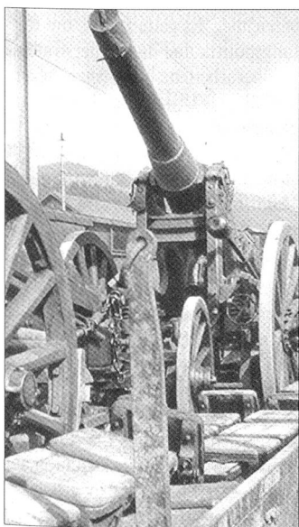
Güterzug mit schweren 12-cm-Kanonen. / Train de matériel avec canons lourds de 12 cm.

Im Übrigen hält die Schweiz als Neutraler an der Reziprozität auch im Transit durch die Schweiz fest, ebenso wie beim Aussenhandel mit den kriegführenden Mächten. Der Bundesrat lässt jedoch eine klare Transitpolitik vermissen und ist vielfach politisch unentschieden; damit schadet er der Verteidigung der schweizerischen Interessen, ebenso wird die Verhandlungsposition bezüglich Gegenleistungen geschwächt. Die Transitpolitik der Schweiz im 2. Weltkrieg ist eine Gratwanderung wie in andern Bereichen auch, doch hat die Schweiz in diesem Bereich ihre Nützlichkeit beweisen können.