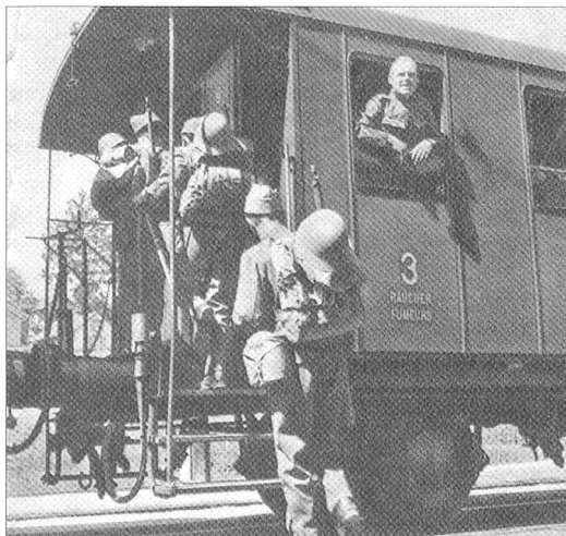
Truppenverladung / Chargement de troupes.