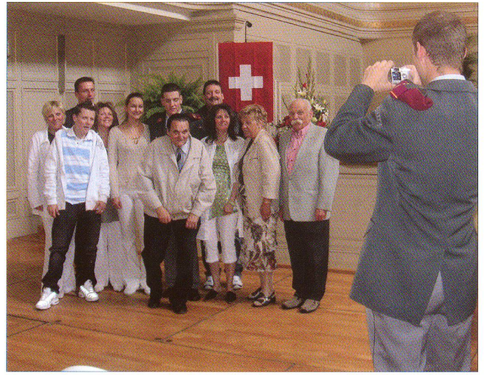
Nun keine Hemmungen – jetzt fotografiert ein frischgebackener Logistik-Offizier einmal seine Liebsten ... und nicht umgekehrt.