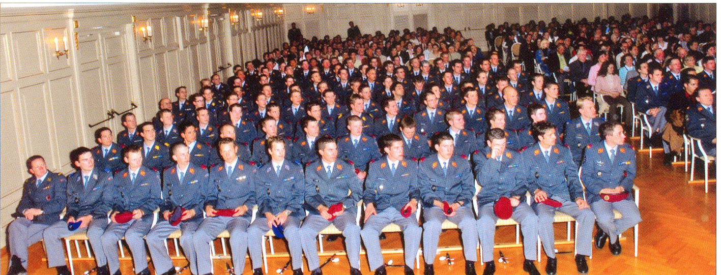
Der Höhepunkt ist wohl jeweils die Beförderung zum Offizier der Schweizer Armee.