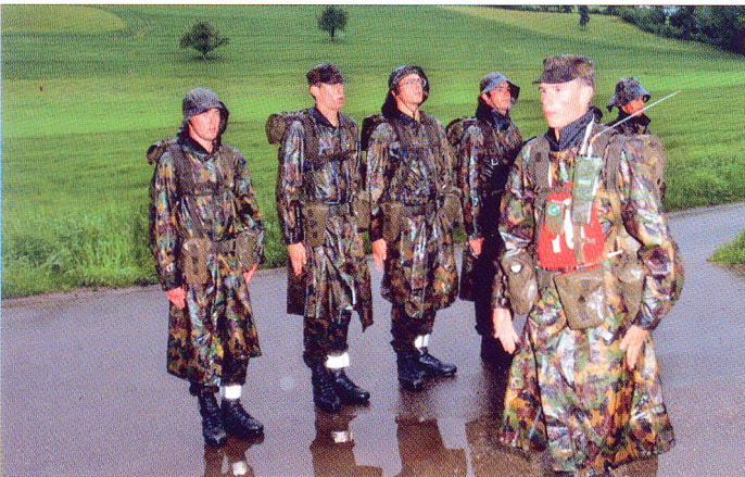
In bester Erinnerung bleibt zweifellos der 100-Kilometer-Marsch vom Löwendenkmal Luzern direkt in die Kaserne Bern.