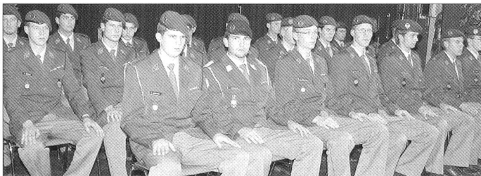
Nebst 19 Wm wurden auch je ein Four und ein Hptfw befördert.

In einer kritischen Phase bezüglich Armee!