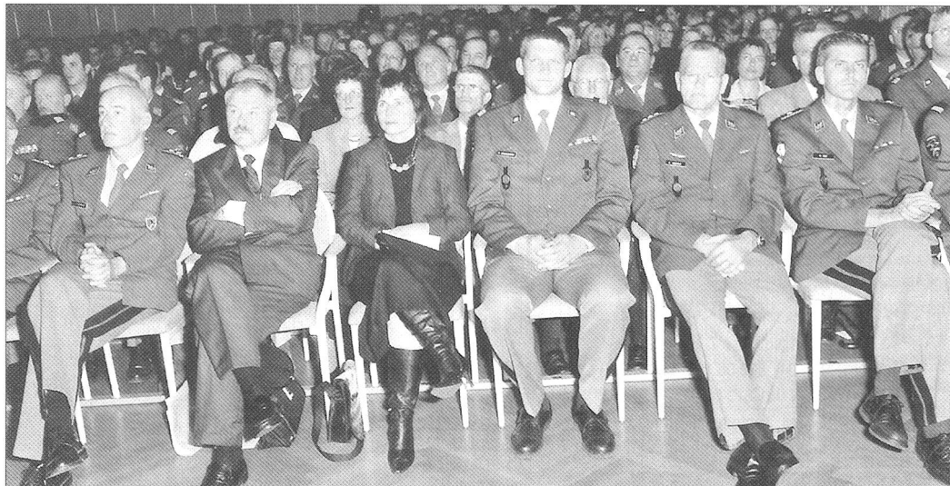
Viel Prominenz wohnte der Beförderungsfeier im Casino in Bern bei; so unter anderen sogar der Chef der Armee, Korpskommandant Christophe Keckeis (Zweiter von rechts). Auf unserem Bild erkennt man auch den Gastreferenten, den Zuger Ständerat Peter Bieri (Zweiter von links).

Beachten Sie bitte auch unsern Bilderbogen auf der zweiten Umschlagseite in dieser Ausgabe!