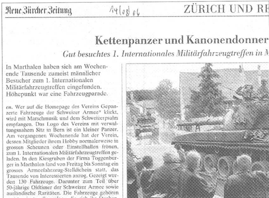
Zeitungsausschnitt aus der «Neuen Zürcher Zeitung» ...

BERN. – r. In der Bundesverwaltung gibt es Bedenken gegen den Vorschlag, eine zusätzliche Kategorie von vertraulichen Dokumenten einzuführen. Dies laufe dem Öffentlichkeitsprinzip zuwider.