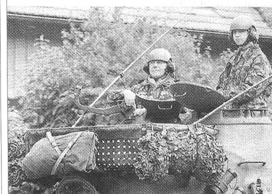
ausragende Technik» und ihre stolzen Besitzer.

en. – Am Samstag gabs im Weinland gleichzeitig Panzerparade zur Street Paziviles Defilee mit Panzern und Armeefahrzeugen. Die kantonale und die Gemeinde Marthalen. – Philipp Studer, P