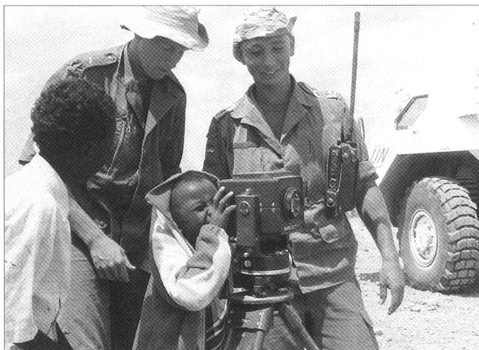
Die Bundeswehr bemüht sich um gute Kontakte mit der Zivilbevölkerung. Unser Bild: Bundeswehreinsatz in Somalia.

Dagegen ist aber genügend Geld für die Beschaffung des milliardenschweren Eurofighters, Panzerabwehr-Hubschrauber und stattlicher Kriegsschiffe vorhanden, mit denen man zwar viel (Eindruck) machen und Geld verdienen, aber nicht Terroristen jagen oder Attentate verhindern kann. Wird dieses sündhaft teure Material eigentlich noch wirklich im vollen Umfang gebraucht oder gibt es ganz andere Gründe für die Beschaffung? Gespart wird eher an den kleinen Dingen, die aber für den im Einsatz stehenden Soldaten lebenswichtig sind. Aber 400 Mio. Euro stehen für die Beschaffung von Panzerabwehrraketen Pars 3 mit langer Reichweite auf der Beschaffungsliste, denen der «Feind abhanden gekommen ist». Bereits vor über einem Jahrzehnt wurden fast alle in Europa stationierten bzw. für einen Angriff vorgesehenen Panzerfahrzeuge verschrottet, vergeblich verläuft die Suche nach Primärzielen für dieses aufwändige Waffensystem: Terroristen. Söldner-Milizen und Freiheitskämpfer verfügen kaum über so genannte «Hochwertziele» und damit fehlt eigentlich die «Geschäftsgrundlage».