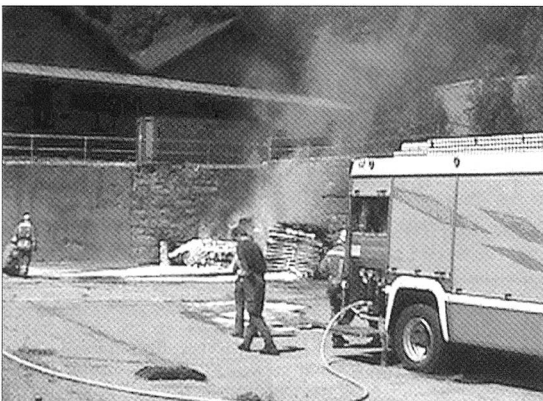
Mit Löschfahrzeugen und Feuerlöschern wurde der lichterloh brennende Scheiterhaufen im Nu gelöscht.

Bei herrlichem und zugleich heissem Wetter erspinnen am 1. Juli knapp 30 Mitglieder bei der IFA (Interkantonales Feuerwehr-Ausbildungszentrum) in Balsthal.