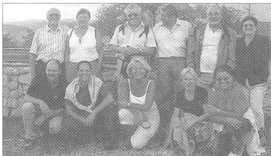
Les membres du groupement jurassien.