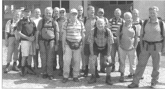
Ein Gruppenbild anlässlich der gelungenen Bergwanderung vom 25. und 26. August im Südtessin.