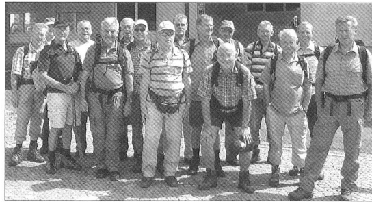
Ein Gruppenbild anlässlich der gelungenen Bergwanderung vom 25. und 26. August im Südtessin.