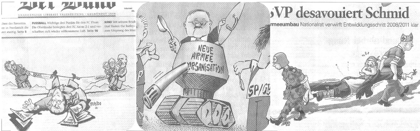
Hochkonjunktur für Karikaturisten: Aus «Der Bund», «Neue Luzerner Zeitung» und «Aargauer Zeitung» vom 4. Oktober.