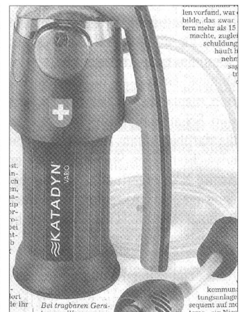
Bei tragbaren Geräten zur Wasserreinigung hat Katadyn einen Marktanteil von über 50 Prozent.

Und noch etwas Wissenswertes: Bergsteigende Gourmets müssen nicht mehr auf ein Glas Rotwein auf dem Berggipfel verzichten. Katadyn hat im vergangenen Jahr den ersten Rotwein in Pulverform und verpackt im praktischen Portionsbeutel auf den Markt gebracht. In der Outdoor-Szene wird der Rote, Alkoholgehalt 9,27 Prozent, inzwischen als Gipfelwein gehandelt.