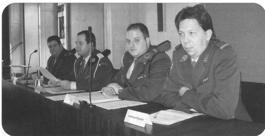
Blick gegen den Vorstandstisch, wo sonst das Kantonsparlament tagt.

Wenn die Hellgrünen jeweils in Zug tagen, scheint sich die ganze Bevölkerung zu freuen. So auch, als die Sektion Zentralschweiz am 15. März die 89. Generalversammlung abhielt.