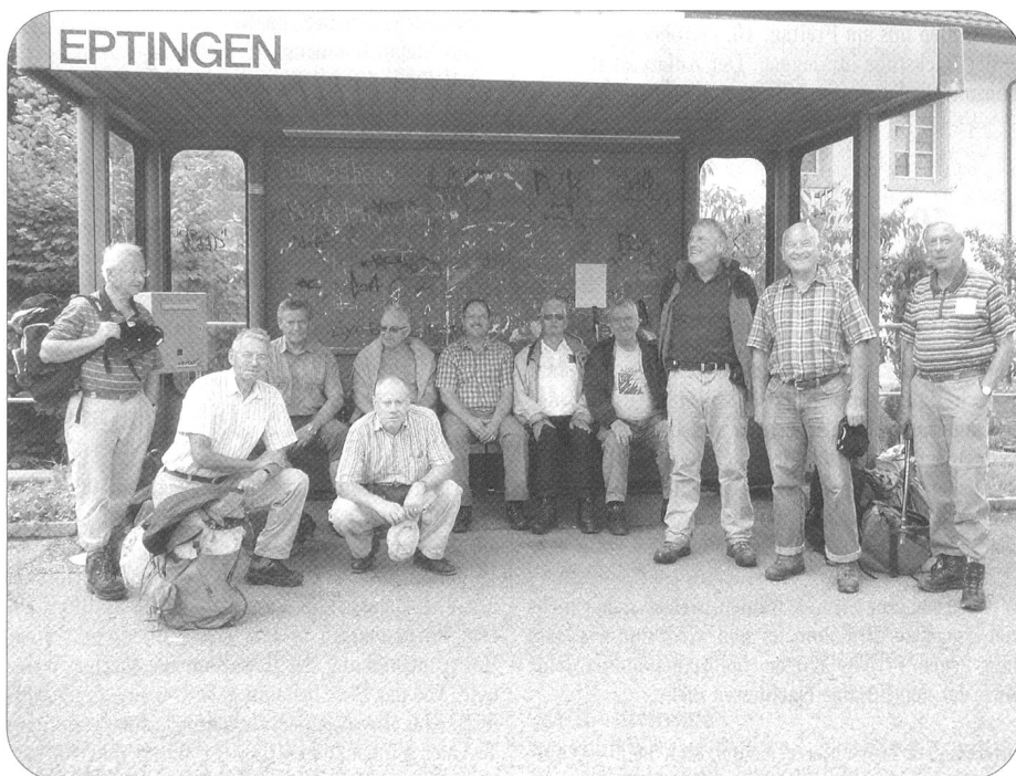
Zuletzt gabs dann noch ein Erinnerungsbild vom zweitägigen Ausflug in den Jura.