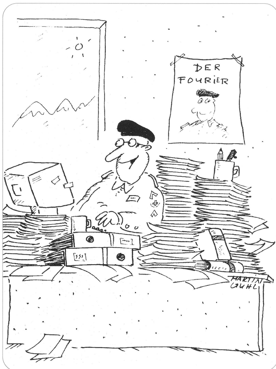
Wie sich doch die Zeiten ändern.