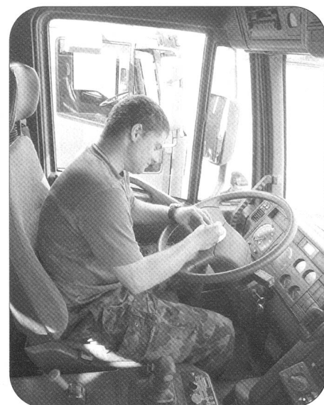
Zur Vorbereitung der Fahrt gehört auch das Ausfüllen der Scheibe des Tachographen.

Text und Bilder: Maj i Gst Dominik Winter, ZSO Kdt Log Br 1 / Chef Mob Log Ber Kompanien 104