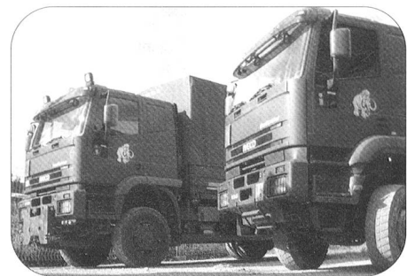
Die Fahrzeuge mit dem Mammut-Logo – unterwegs auf Schweizer Strassen oder hier im Fuhrpark der Mob Log Ber Kp 104.

Stalden im Emmental, 0830 Uhr. Am Standort der Mob Log Ber Kp 104-1 geht der Auftrag in der Transportzentrale ein. Oberleutnant Martin Geisser ist Zugführer des Durchdiener-Transportzuges und damit auch zuständig für die Transporteinsätze. Er prüft den Auftrag, entscheidet, welche Motorfahrer seines Zuges und welche Fahrzeuge aus dem grossen Fuhrpark der Kompanie eingesetzt werden und nimmt den Befehl in die Planung für den übernächsten Tag auf.