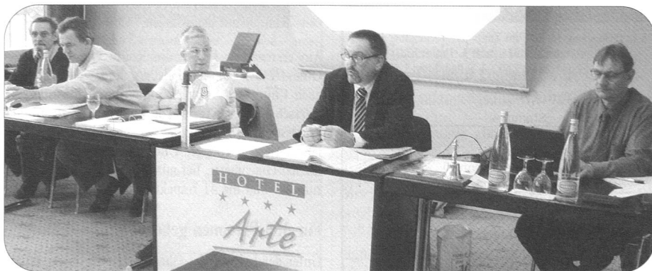
Gut vorbereitet und speditiv wickelte der Zentralvorstand die Geschäfte ab.