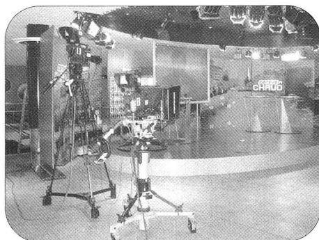
Plateau prêt pour l'émission «Genève à chaud».