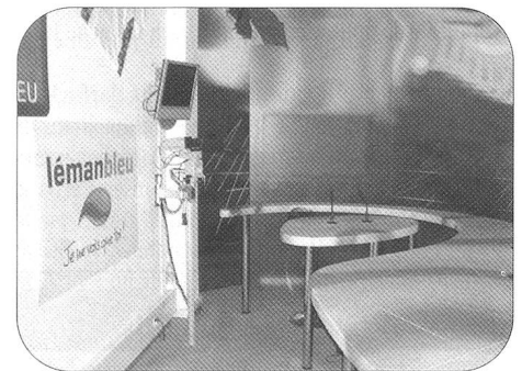
Plateau du «Journal TV».

Une quinzaine de membres du groupement genevois de l'ARFS se sont retrouvés devant les locaux de la