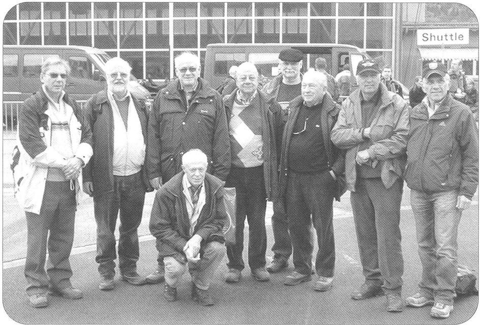
Participants de l'ARFS à l'exercice de l'Axalp.

Préavis: notre collaborateur permanent Michel Wild a traduit en français le compte-rendu sur la victoire olympique de nos cuisiniers militaires à Erfurt, Allemagne (cf. l'article en allemand figurant dans le dernier numéro). Pour des questions de place, nous sommes malheureusement contraints de reporter la version française dans le prochain numéro. Nous vous remercions de votre compréhension.