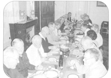
une belle table...