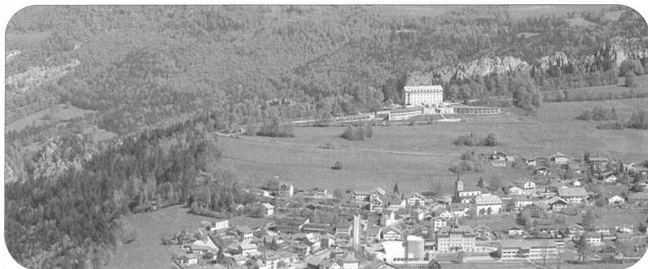
Le Noirmont avec la clinique.

Les premiers habitants étaient bûcherons, chasseurs, agriculteurs, récolteurs de poix (d'où le surnom ancien de «Poilies»). Ils affichèrent très tôt une ténacité, une persévérance, un courage peu communs.