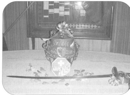
la fameuse marmite en chocolat (4,520 kg)

Grâce à la généreuse hospitalité de nos amis de l'ASSO, on se retrouve dès 18h dans la maison que construisit et habita un célèbre genevois, le Général Guillaume-Henri Dufour. On s'installe en cercle et on bavarde autour d'une grande table en trinquant d'un excellent chasselas de Dardagny.