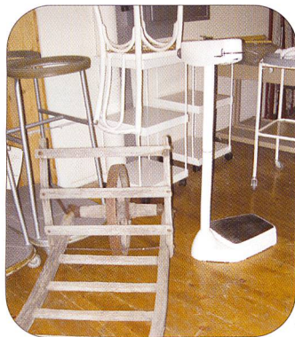
Bei einem Rundgang konnten sich alle ein Bild machen, wie geschickt sich eine ehemalige Höhenklinik in eine militärisch genutzte Unterkunft umfunktionieren lässt.