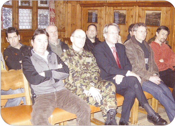
Gemeindepräsidenten, Ortsquartiermeister der Unterkunfts-gemeinden WEF 09 sowie Gäste aus Kantonspolizei, Militär und Verwaltung hörten gespannt den verschiedenen Ausführungen zu.