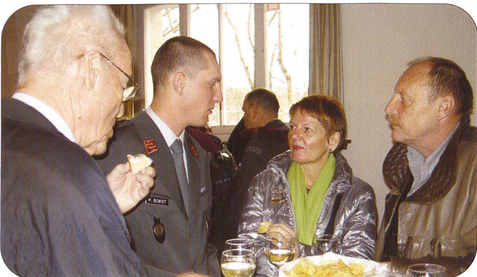
Ein stolzes Kaffeekränzli unter Familienangehörigen ...