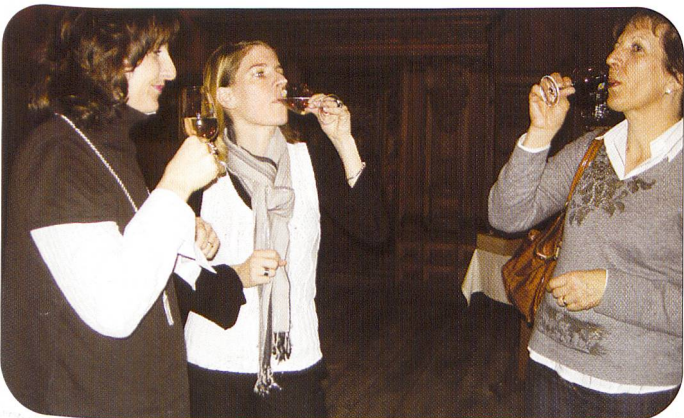
Schon lange keine Männerdomäne mehr ist die Kontaktpflege zwischen der Truppe und dem Militär – zum Wohl auf die gute Zusammenarbeit!