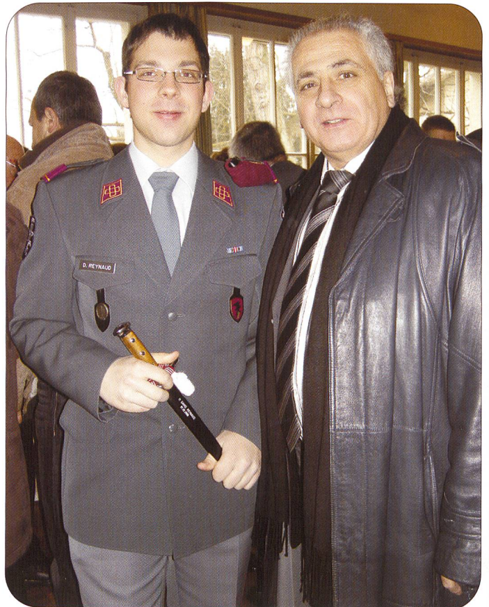
... oder in befreundetem Kreis.