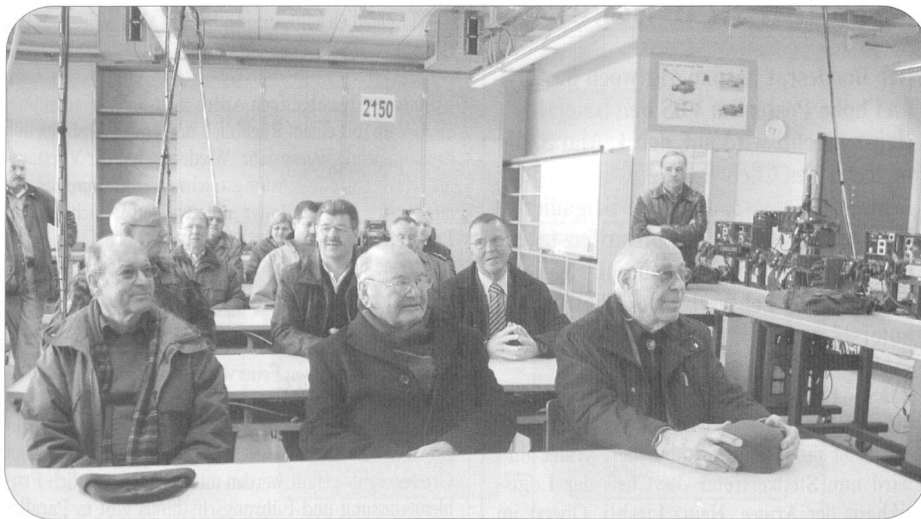
Kurzweilig und höchst interessant war die Führung durch die Ih Schulen 50 in Thun.