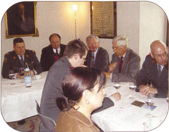
Natürlich sass «der harte Kern» wieder einmal gemütlich beisammen.

HITZKIRCH. – Rund ein Zehntel der Mitglieder des SFV, Sektion Zentralschweiz, folgte der Einladung des Vorstandes zur Jubiläumsversammlung ins historische Schloss Heidegg. Mehr darüber auf Seite 20 in dieser Ausgabe!