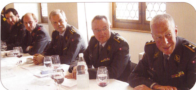
Mit von der Partie waren auch hochkarätige Militärs.