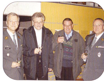
Ein Gruppenbild, umrahmt von zwei Generälen – wieso nicht?