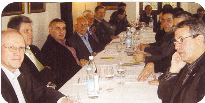
Aufmerksam verfolgten die Teilnehmer die Geschäfte.