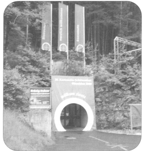
Eingang zur Anlage Brünig Indoor.

Kennen Sie die weltweit einzigartige unterirdische Schiessanlage Brünig Indoor? Wenn nicht, dann haben Sie wahrlich etwas verpasst. Schiessen bei Kunstlicht ist nämlich gewöhnungsbedürftig. Die Luft ist mit Pulverdampf geschwängert und die Sicht im 300 m Schiesstunnel mit 3-stöckiger Scheibenanordnung ist getrübt durch einen leichten Nebelschleier.