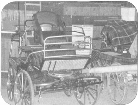
Encore d'autres véhicules.