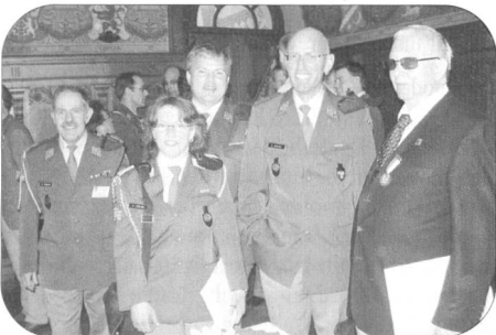
Ein Erinnerungsbild der gut gelaunten Berner Delegation an der DV des SFV in Bellinzona.