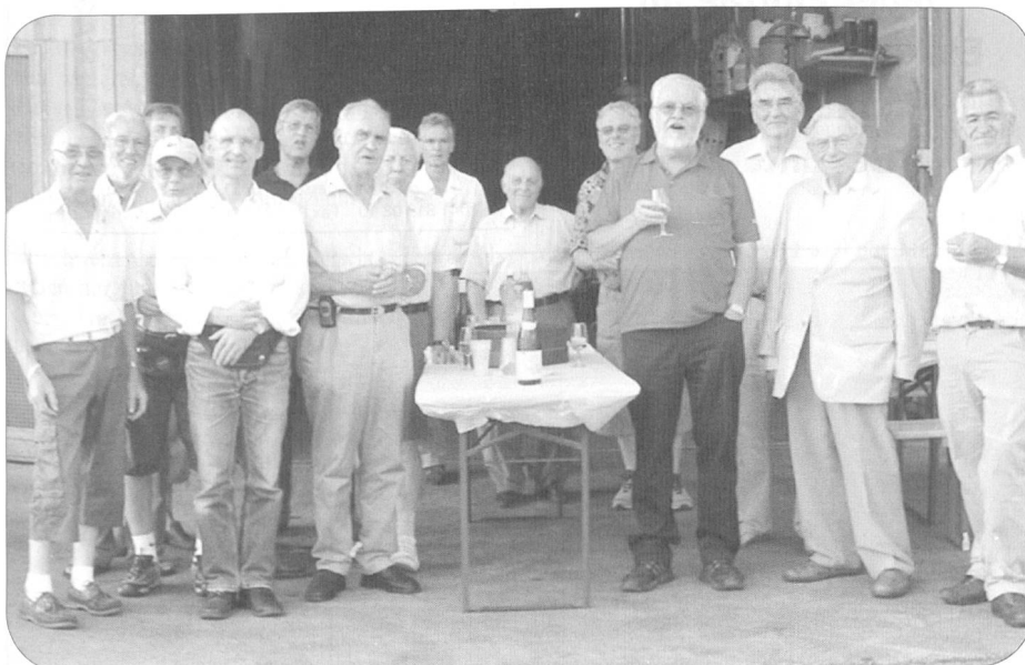
Tous les participants réunis avant le repas