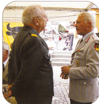
Ein ernsthaftes Gespräch unter Freunden (links), während Div Jean-Jacques Chevalley (rechts) aufmerksam den verschiedenen Reden folgte. Offensichtlich fühlte er sich wohl, den Bürojob im Bundeshaus wieder einmal mit der Front tauschen zu können.