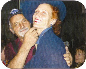
Zu historischen Militärfahrzeugen gehört ebenfalls die passende «Uniform».