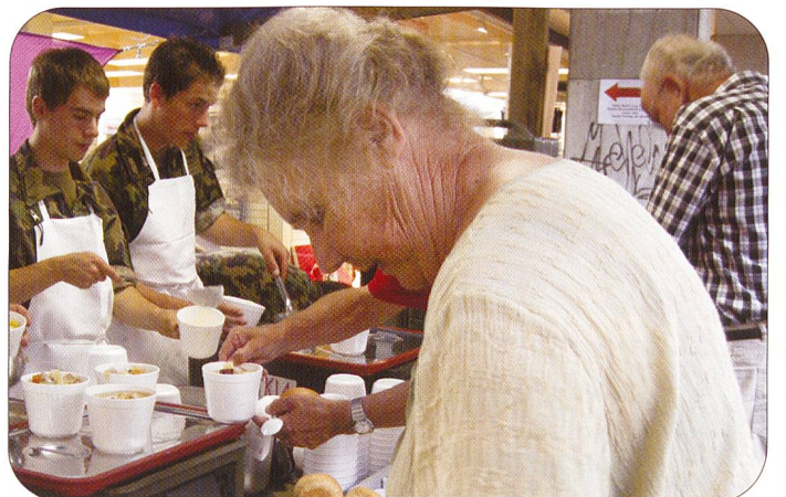
Zeitweise standen Jung und Alt vor den verschiedenen Ständen des Küchenchefelehrgangs Thun regelrecht Schlange. 5000 Portionen fanden schliesslich dankbare Abnehmer.