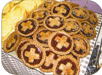
Sogar eine Feldbäckerei mit vielen guschtigen Sachen war in Betrieb.