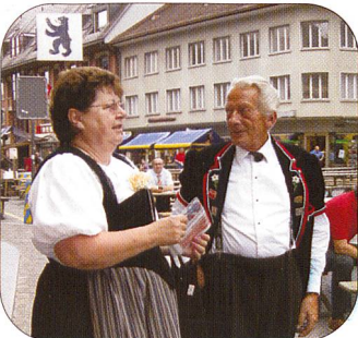
Alles was Rang und Namen hat, traf sich am 21. August in Langenthal zum Schweizerischen Miliz- und Militäranlass.