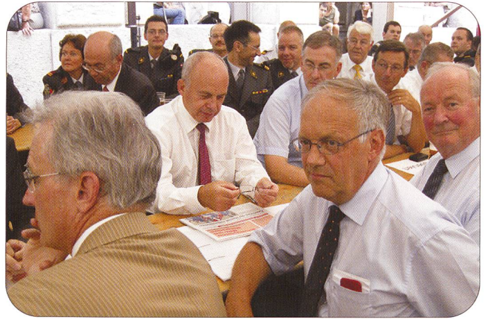
Bundesrat Ueli Maurer und Nationalrat Johann Schneider-Ammann.