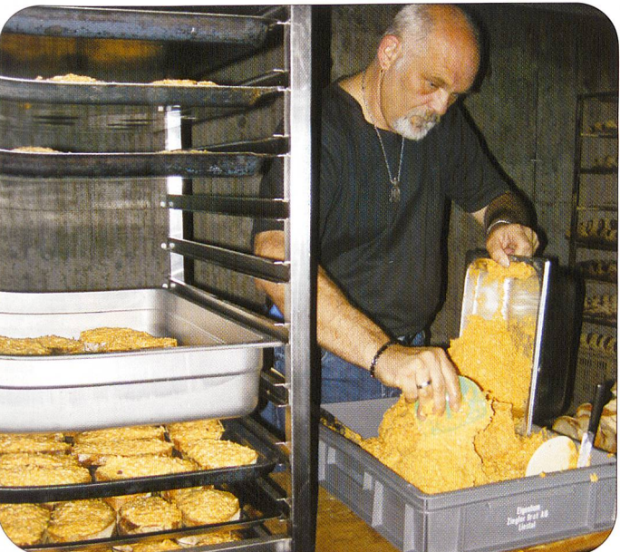
Echte Militärkäseschnitten sind stets ein Renner.