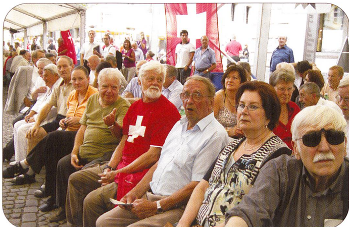
Aufmerksam verfolgten die Zuhörer den verschiedenen Ausführungen von hochkarätigen Referenten und halten es mit Bundesrat Ueli Maurer: «Wir rufen nicht nach dem Staat, weil der Staat immer schon ganz nah ist.»