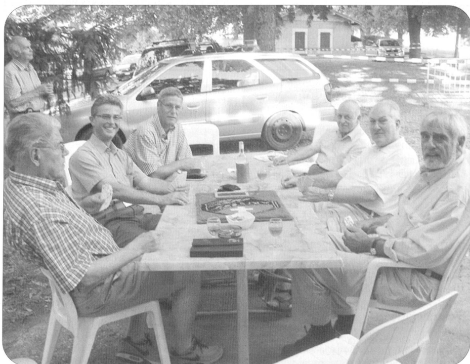
Le chibre, c'est plus décontracté.