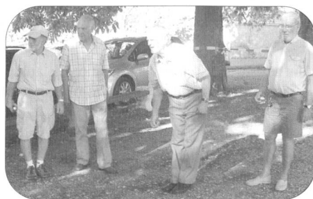
Mais où va arriver la boule?

Un tout grand merci donc aux quatre sponsors de cette agréable soirée qui se terminera, comme chez Astérix et Obélix, bien après le lever d'une magnifique pleine lune. (HG)