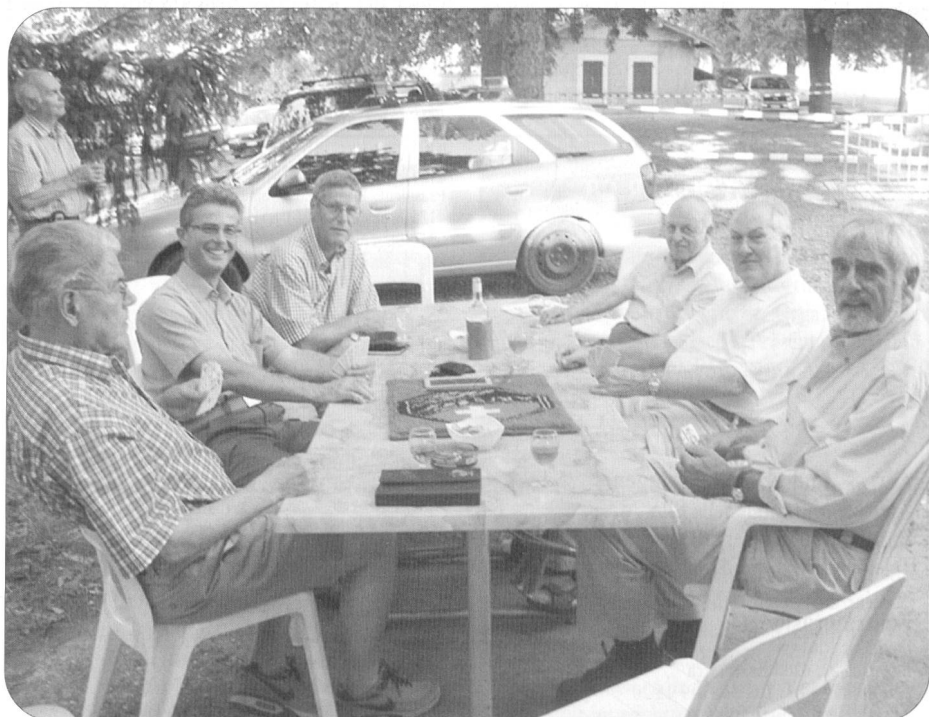
Le chibre, c'est plus décontracté.