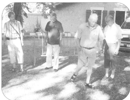
Elle est partie...