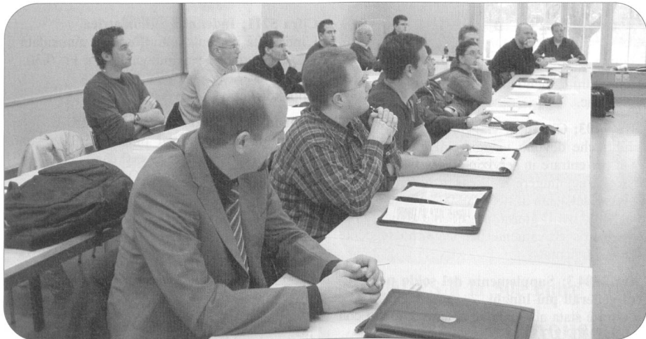
Aus erster Hand liessen sich in Luzern, Kloten, Bern und etwas später in Fribourg Fouriere und Quartiermeister über die Neuerungen im Truppenrechnungswesen informieren. Somit sind sie bestens auf die kommende Dienstperiode vorbereitet. Alle jene, die diese Dienstleistung der LBA und Verbände verpassten, werden das Versäumte mindestens vordienstlich in Eigenregie nachholen müssen.