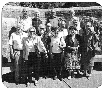
Les anciens du comité central ASF

HG - Depuis fort longtemps, les anciens du comité central et de la commission technique centrale qui avaient assumé le Vorort romand