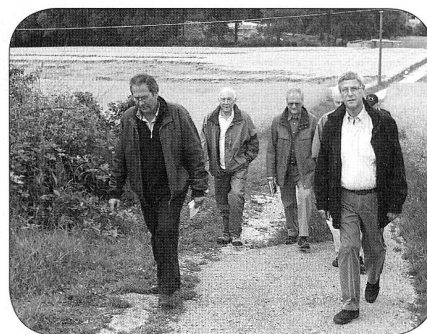
En pleine marche...