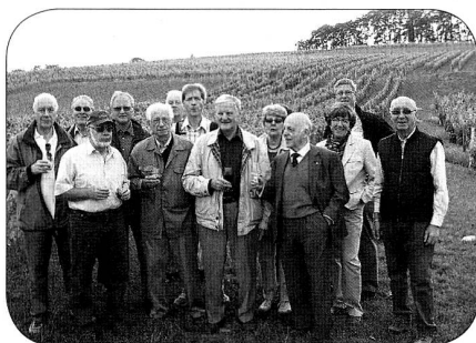
Vignes derrière – produit dans les verre!