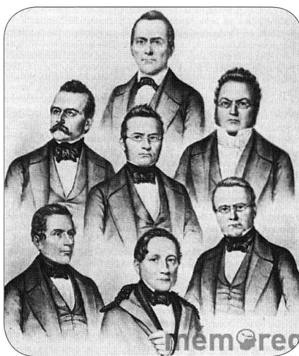
Der erste Bundesrat 1848; Ulrich Ochsenbein, erster links, Mitte

Die Kommissionsarbeit erfolgt in vier Sektionen unter Ausschluss der Öffentlichkeit. Nach 51 Tagen, am 8. April 1848, ist die Arbeit der Verfassungsrevisionskommission beendet. In der Tat eine unerreichte Meisterleistung!