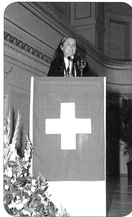
Ansprache von Nationalrätin Yvette Estermann, SVP, Luzern