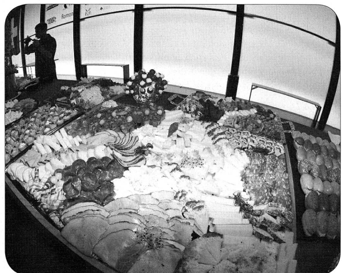
Detail des Apéritif