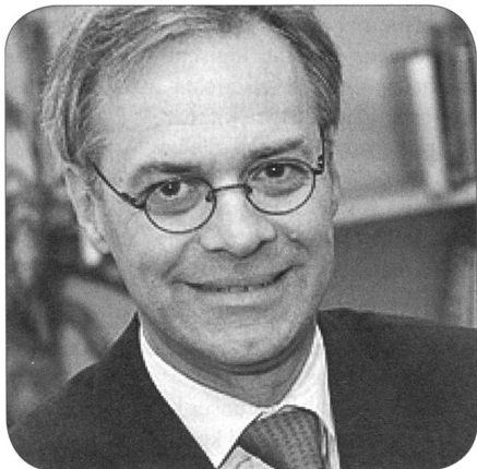
Prof. Dr. Rainer Münz

Am Ende des Jahres steht eine aktuelle taktische Grundlage zur Verfügung, welche es ermöglicht, dass darauf basierend eigene Übungen entwickelt oder angepasst werden können.»