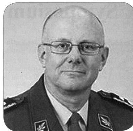
Div Philippe Rebord