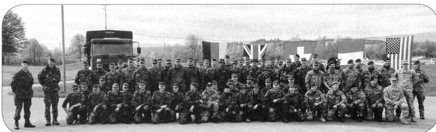
Die Teilnehmer aus Deutschland, England, Schweiz, der USA und Italien bei der Zeremonie vor der Siegerehrung.