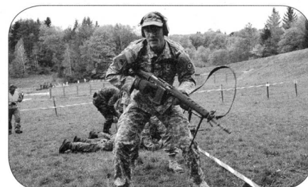
Der Posten «Pirelli» verlangte nach körperlicher Anstrengung eine sichere Waffenhandhabung.