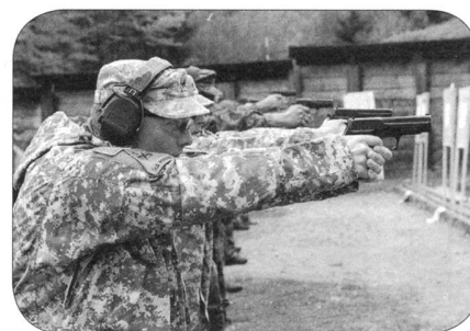
Der Posten «Pistoleros» verlangte nach einer ruhigen Hand.

der RUAG Ammotec AG, Victorinox AG, MB-Microtec AG – Traser H3 Watches, B & T AG, MOWE SA, Fielmann AG, Dillier Feuer & Platten SA, Hero Lenzburg, Ragusa, SIUS AG, BRUNOX AG, TRISA, HUG AG, Schild Waffen AG, LVb Log - Küc Schule sowie «Präsenz Schweiz» des Eidgenössischen Departements für auswärtige Angelegenheiten (EDA) zählen. Die SOLOG-Sektion Mittelland, die Unteroffiziersgesellschaft der Schweiz, nicht genannte Gönner sowie Die Mobiliar-Generalagenturen Bern haben den Anlass zudem finanziell unterstützt.