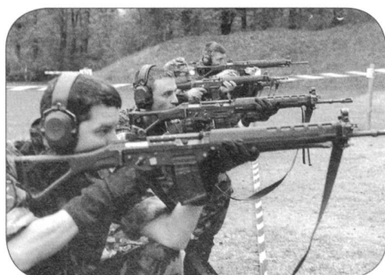
Der Posten «Pirelli» verlangte nach körperlicher Anstrengung eine sichere Waffenhandhabung.

Für den Gabentisch konnten die Organisatoren zudem auf die grosszügige Unterstützung