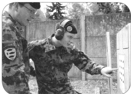
Der Posten «Different Targets», wo das korrekte Einschiessen zu den gewünschten Treffern führte.