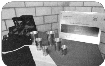
Zinnbecher als Hauptpreise für die drei besten Teams umrahmt mit den Spezialpreisen Glock-Pistole und Taser-Watch.