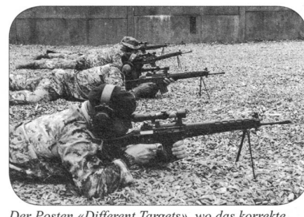
Der Posten «Different Targets», wo das korrekte Einschiessen zu den gewünschten Treffern führte.