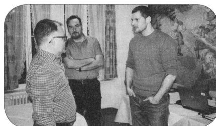
Diskussionen vor der GV