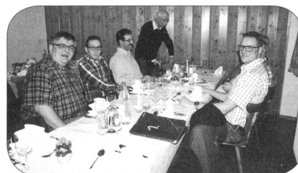
Gelöste Stimmung vor der GV

Ich mache mir die gute Information zur Gewohnheit und wünsche ARMEE-LOGISTIK jeden Monat in meinem Briefkasten. Zuerst zwei Monate gratis. Dann im preiswerten Abonnement: