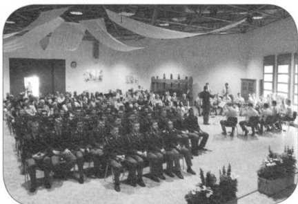
Saal Hotel Weisses Kreuz, Lyss