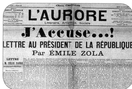
Émile Zola J'accuse topelement

Comment a-t-on pu espérer qu'un conseil de guerre déferait ce qu'un conseil de guerre avait fait? Je ne parle même pas du choix toujours possible des juges. L'idée supérieure de discipline, qui est dans le sang de ces soldats,