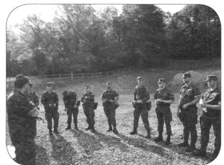
Höh Uof Anw in der KD Box