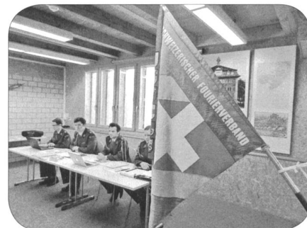
Der aktive Vorstand