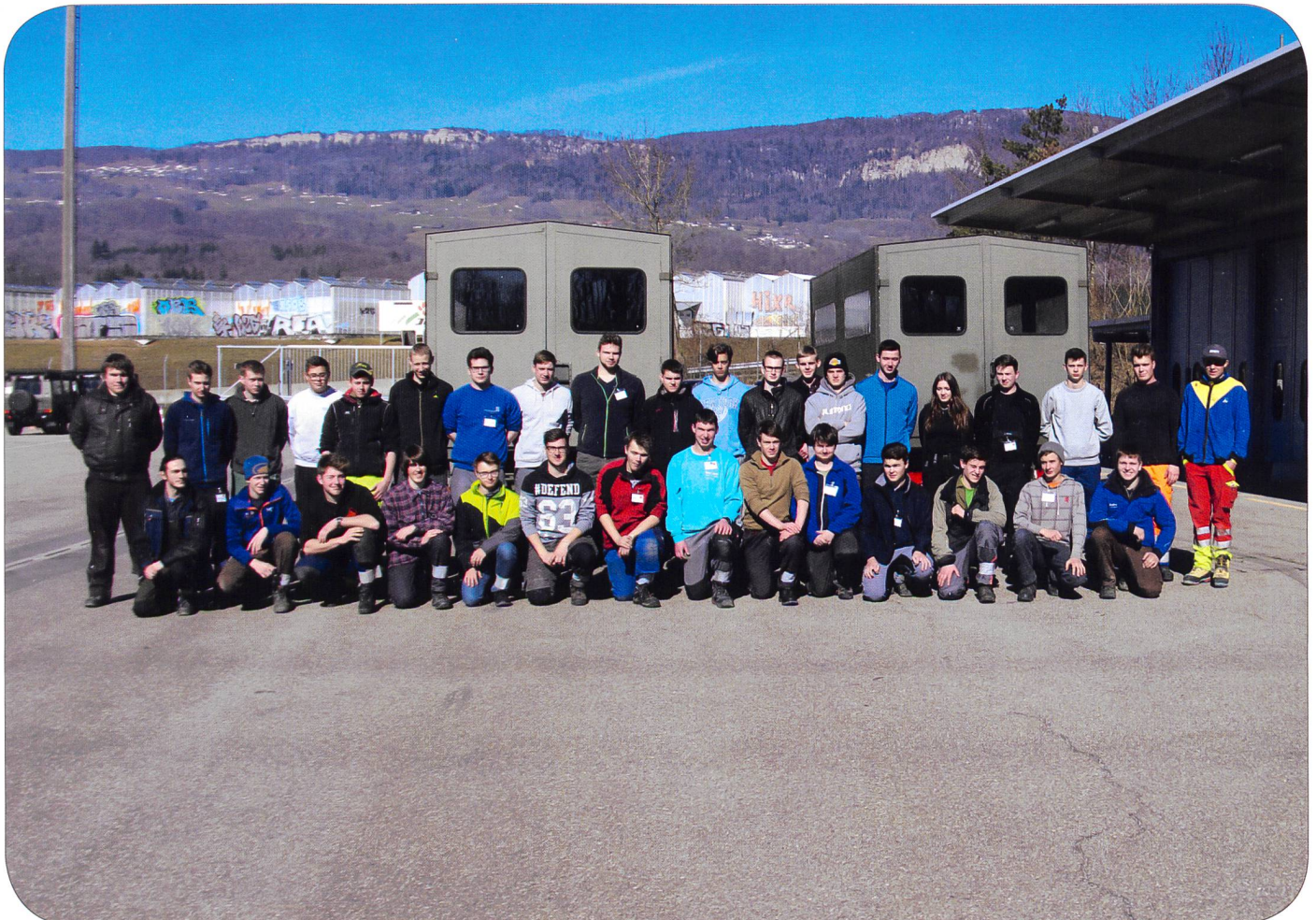
Gruppenfoto der JMF