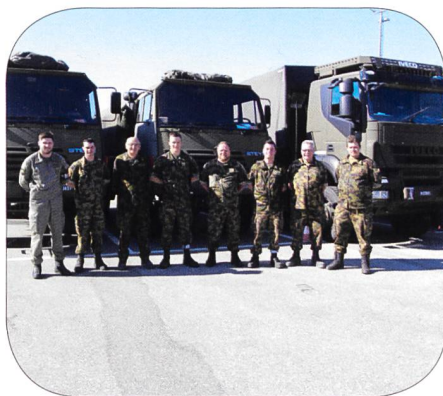
Referententeam Region 3