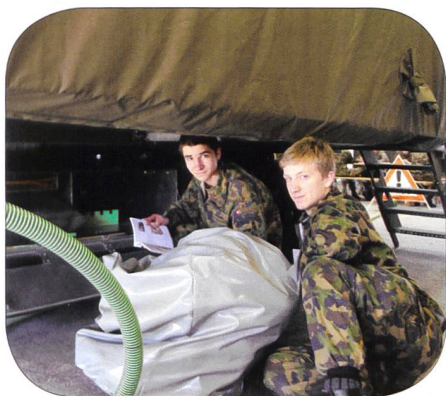
Selbststudium am MVS