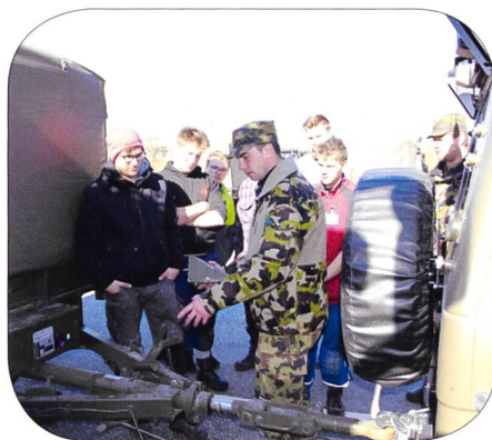
Einführung in FZ Anhänger