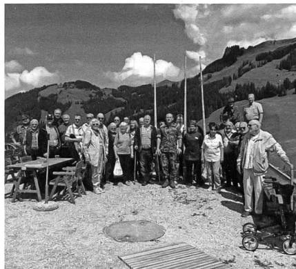
Gruppenfoto der Pensionäre der Ns S 45

In diesem Jahr werden die Hälfte der zehn direktunterstellten Kommandanten des LVb Log ausgewechselt. Über die Wechsel im Kompetenzzentrum Veterinärdienst und Armee Tiere, an der Instandhaltungsschule und im Kommando Ausbildungszentrum Verpflegung habe ich in den letzten Ausgaben berichtet. Im Herbst erfolgt noch der Wechsel in der Spital-