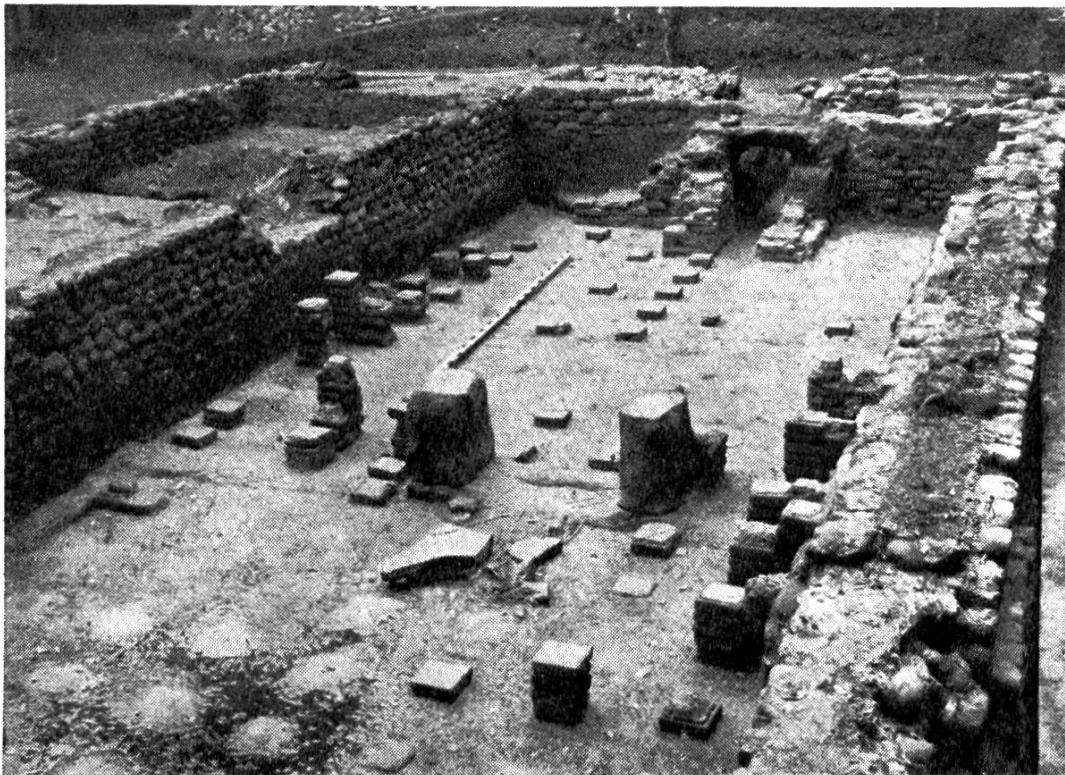
Abb. 11. Römisches Bad auf der Engehalbinsel. Heissluftheizung mit Feuerschacht.