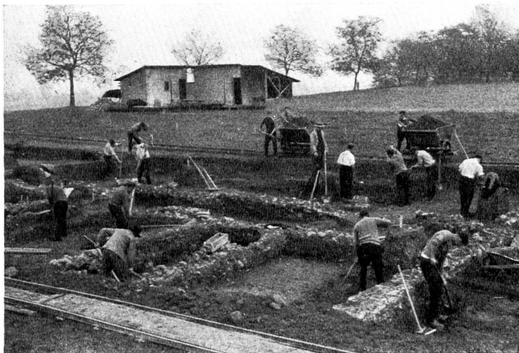
Abb. 13. Vindonissa 1937. Die Fundamente eines Militärbäudes werden freigelegt.

kanal der Via principalis freigelegt. Es erschienen alsbald zahlreiche, hübsch gehauene Steinsockel der Strassenlauben in regelmässigen Abständen und dahinter viele Mauerzüge eines ausgedehnten Gebäudes mit kleinen und grossen Räumen, Wasseranlagen, vielleicht kleinen Badezimmern, Feuerstellen und Gängen. Was es werden soll, ist noch nicht klar; aber dass es sich nicht um gewöhnliche Kasernen handeln kann, ist heute schon deutlich zu ersehen. Nach der Auffindung der wichtigen Lagerthermen und des Spitals ist die Spannung der Fachleute umso grösser, als man immer noch keine Kenntnis vom Palast des Legionskommandanten, vom Hause des Lagerpräfekten, von den Wohnungen der Tribunen (höheren Offiziere) u. a. m. hat.