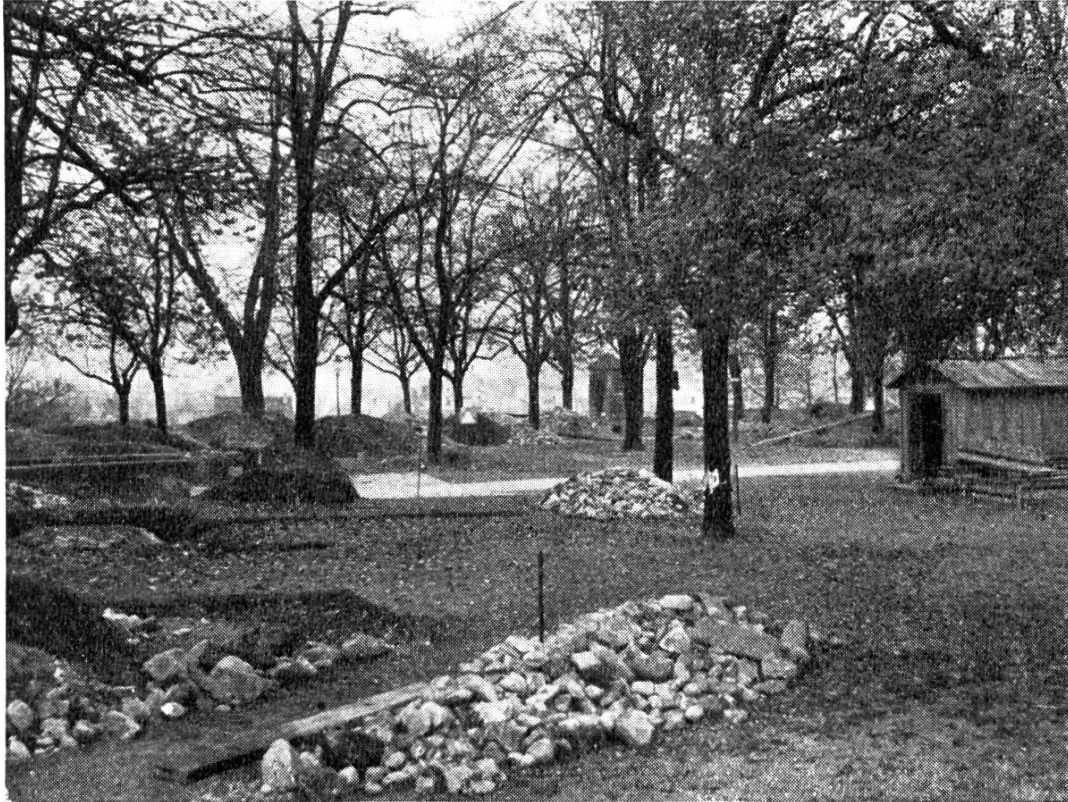
Abb. 12. Der Lindenhof-Zürich mit den Suchgräben der Ausgrabung 1937.

übernahm die Grabungsleitung, der Technische Arbeitsdienst stellte ihm die nötigen Zeichner zur Verfügung. Bald zeigte sich, dass es sich hier um eine äusserst komplizierte Ausgrabung handelt. Interessant ist, dass der Moränenhügel des Lindenhofes keine prähistorische Besiedlung kannte. Die ältesten Funde setzen mit der frühromischen Zeit ein, kurz nach Christi Geburt (spät-arretinische Terra Sigillata). Auch in der mittleren Römerzeit war der Platz besetzt. Aber erst das 4. Jahrhundert hat hier dauernde Baureste hinterlassen. Die 2 m starke Umfassungsmauer des Kastells ist gefunden, ebenso das mächtige Fundament eines vorspringenden, aussen polygonalen Turmes, und ein Teil der Toröffnung. Darüber lagern nun nicht weniger als vier Bauperioden aus dem frühern Mittelalter, von denen besonders die zweite bereits einen klaren Grundriss ergeben hat. Ein 50 m langer und 12 m breiter Haupttrakt, vielleicht ein grosser Hallenbau, liegt