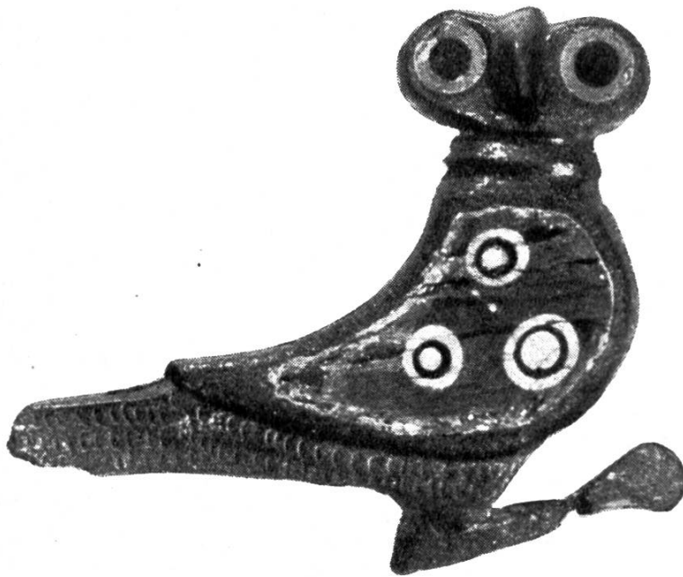
Abb. 10. Eulenfibel (vergrössert), gefunden in Petinesca.

und die Einheimischen einst zu Wallfahrten auf den Berg einlud. Bis jetzt konnten drei grössere Tempel, zwei Kapellen und ein Wohngebäude ganz oder teilweise ausgegraben werden. Sie stammen alle aus der Römerzeit (1.—4. Jahrh. n. Chr.). Die Tempel sind quadratisch. Der grösste besitzt eine Seitenlänge von 15,4 m. Er besteht wie alle diese im römischen Gallien weit verbreiteten Kultbauten, aus einem einzigen Raum für das Götterbild und einer ringsum führenden Säulenhalle. Der ganze Bezirk ist umsäumt von einer Hofmauer, deren Fundament überall noch in vorzüglicher Ausführung erhalten ist und eine gestreckte Fläche von rund 200 m Länge umschliesst.