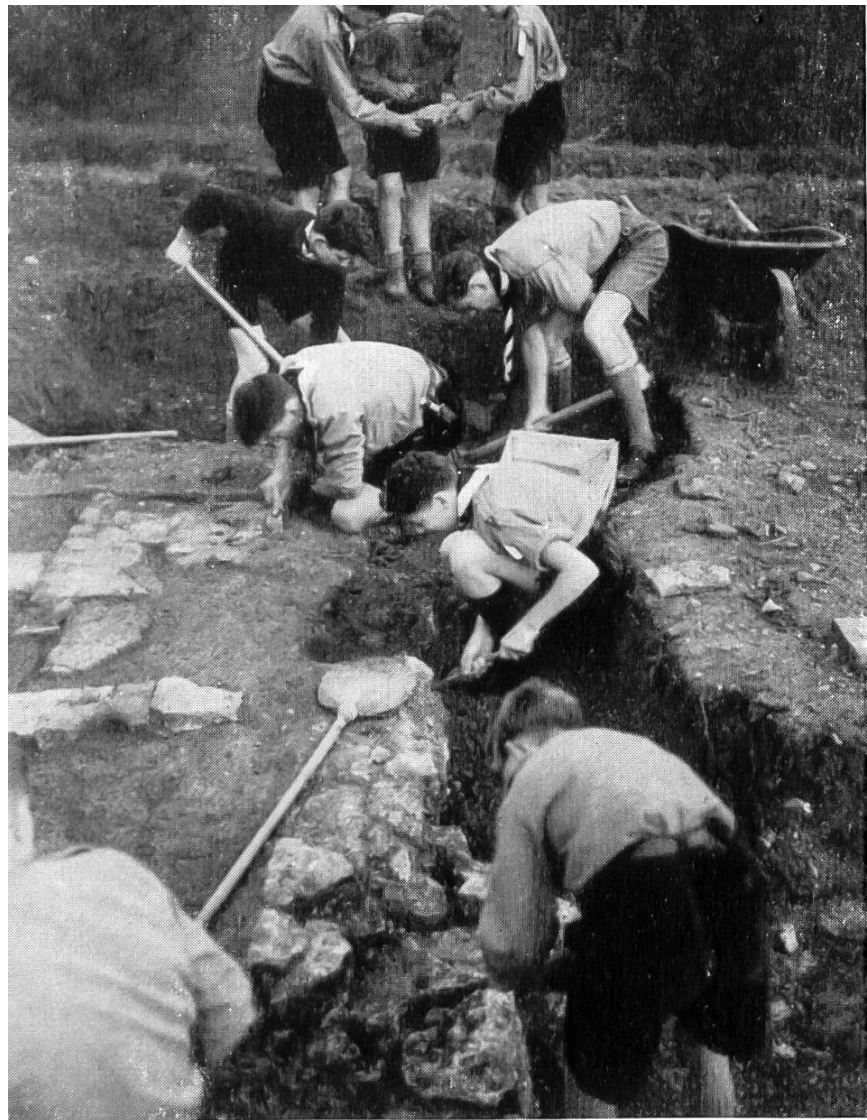
Abb. 36. Lausen. Basler Pfadfinder als Ausgräber.