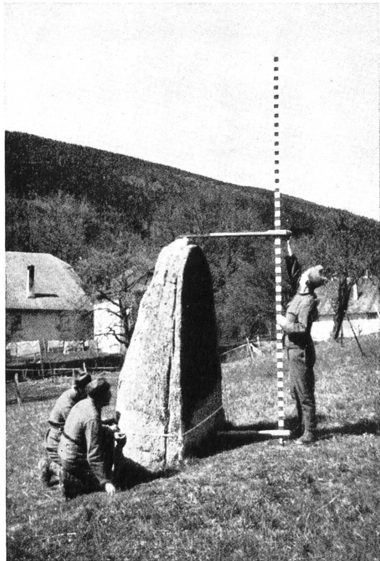
Abb. 2. Messungen am Objekt.