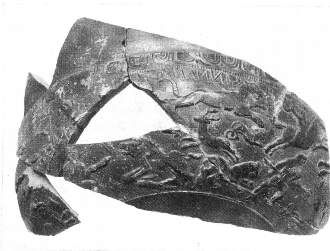
Abb. 42. Kempraten. Terra sigillata-Schüssel des Cinnamus mit Tierhatzen. (2. Jhh. n. Chr.)

In den obersten Schichten trafen wir Terra sigillata aus dem dritten nachchristlichen Jahrhundert, währenddem die grosse Masse der Funde — einige hundert Scherben, Nägel