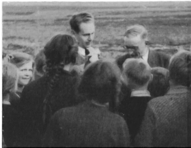
Fig. 42. Breitenloo. Der Grabungsleiter erklärt einer Schulklasse die Funde.

daran erinnern, dass sie in unserem Lande an einer interessanten kulturellen Aufgabe mitgearbeitet haben. Und wir? Noch in Jahrzehnten werden wir, wenn wir vom Pfahlbau Pfyn sprechen oder wenn wir das im Entstehen begriffene Lokalmuseum in Pfyn mit seinen kostbaren Funden betrachten, uns daran erinnern, dass es Polen gewesen sind, die ihm ihre Kräfte gewidmet und dies mit Hingebung und Liebe getan haben. Es hat einmal in Rapperswil ein Polenmuseum gegeben, das auch für uns Schweizer so etwas wie ein Heiligtum war und durch das wir uns mit dem Land im Osten tief verbunden fühlten. So etwas von diesem Geist wird uns bleiben im Gedanken an das Breitenloo bei Pfyn.