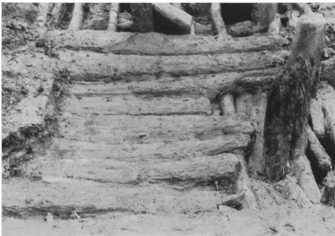
Abb. 37. Breitenloo. Eichenfussboden.