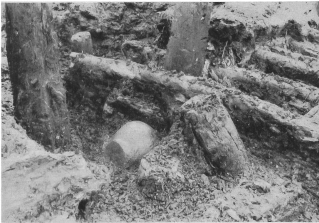
Abb. 39. Breitenloo. Topf unter Fussboden.