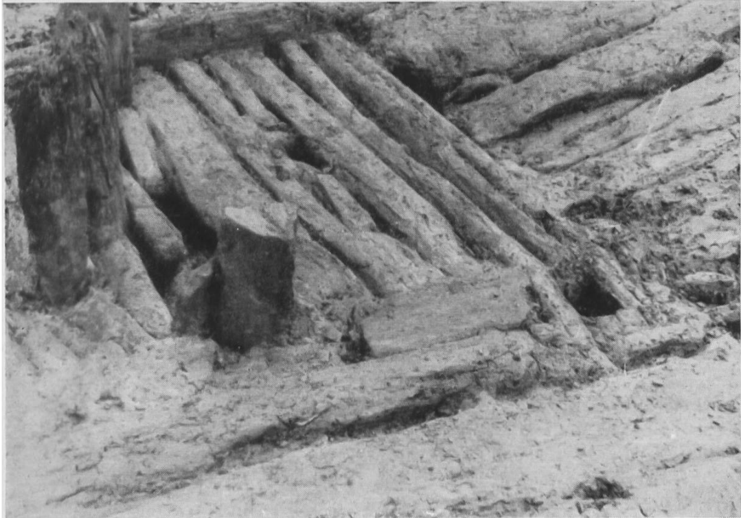
Abb. 38. Breitenloo. Fussboden mit Firstträger der Hütte.