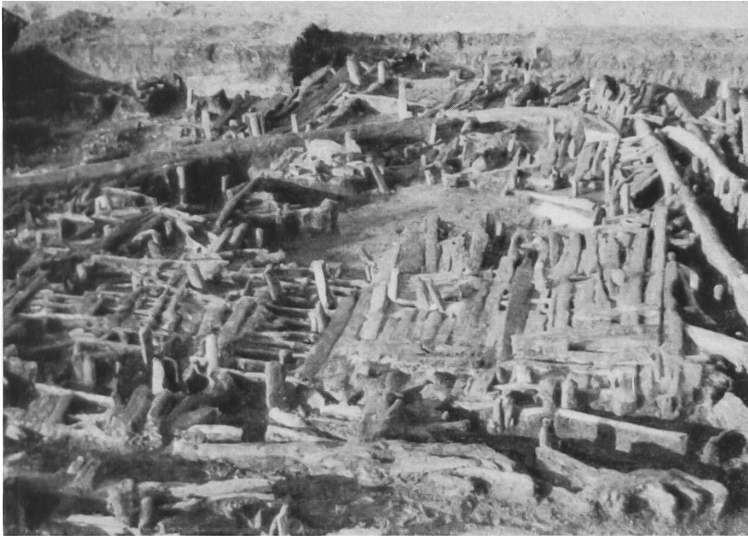
Abb. 36. Breitenloo. Übersicht über ca. einen Drittel des ausgegrabenen Pfahlbaus.