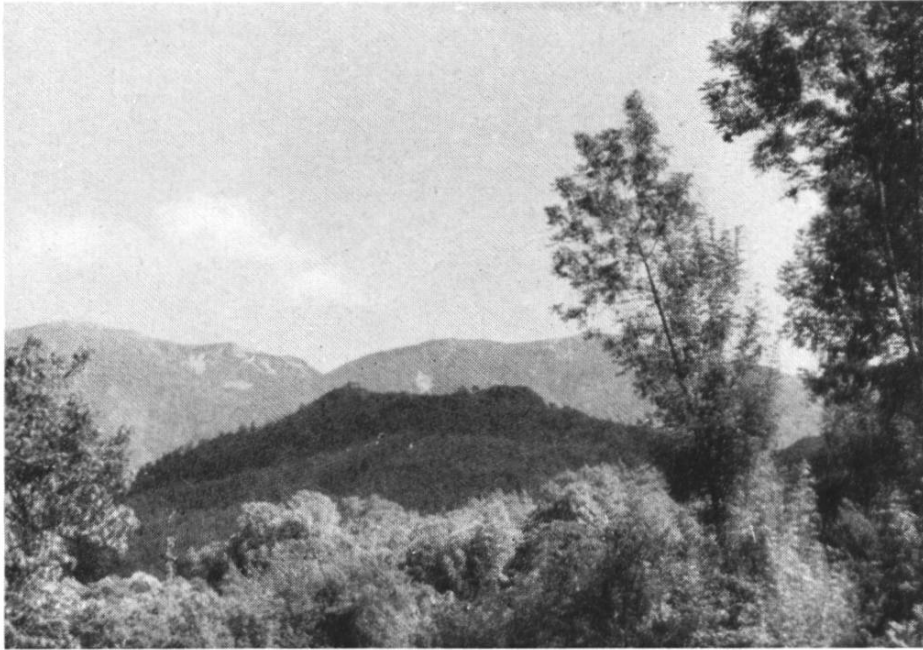
Abb. 6. Balla Drume im Sommer, von Norden.

Es liegen kennzeichnende Rand- und Bodenstücke, sowie einige Verzierungen vor, darunter nichts was nicht auch diesseits der Alpen in keltischem Inventar gefunden werden könnte. Da ein einziger Scherben noch Anklänge an die frühe Eisenzeit zeigt — aber ein Randprofil der späten Eisenzeit —, so darf mit allem Vorbehalt auf ungefähr 4. und 3. Jahrhundert geschlossen werden. Freilich ist es angezeigt, im Tessin auch die Golaseccastufen zur Datierung heranzuziehen; es besteht kein Zweifel, dass im Golaseccainventar ähnliche Scherben auftreten. Wenn man aber weiss, wie stark, gerade im Tessin, die keltische Kultur auf die italischen gewirkt hat — man kann vielleicht auch sagen, dass die italischen Kulturen die keltische stark beeinflusst haben —, dann weiss man auch, dass typisch keltische Gefässe sich überall eingedrängt haben. Nehmen wir dazu, dass der Name Balla Drume ebenfalls keltisch ist, so haben wir vorderhand keinen Grund anzunehmen, dass nicht die ganze Festung, von der hier die Rede ist, keltischem Stamme angehört.