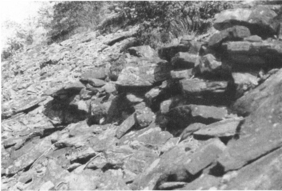
Abb. 5. Balla Drume. Stützmauer der Strassenrampe, die auf den Balla Drume führt.

macht einen imponierenden Eindruck. Sie hat ursprünglich eine Breite von mindestens 3 m besessen und war mit plattigen Steinen abgedeckt. Der ganze Unterbau ruht auf aufgeschichteten Steinen; an den besterhaltenen Stellen sind heute noch die talseitigen Stützmauern gut zu erkennen. Sie besitzen eine Höhe bis zu über einem Meter. Aus der ganzen