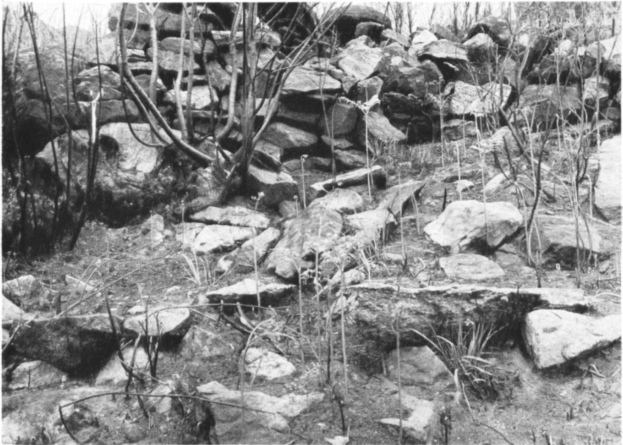
Abb. 4. Balla Drume. Teil einer Sperrmauer.

gehören schliesslich noch einige Vorwerke, die die ganze Anlage gewaltig ausdehnen. Sie zeigt in der Länge ein Ausmass von ungefähr 600 m und eine Breite von 300 m. Dazu muss aber bemerkt werden, dass nicht alle Trockenmauern zur urgeschichtlichen Anlage gehören; es sind vielmehr im Kriege 1914/18 auch solche von schweizerischem Militär errichtet worden. Bei genauem Studium aber lassen sich die modernen Mauern genügend von den alten unterscheiden.