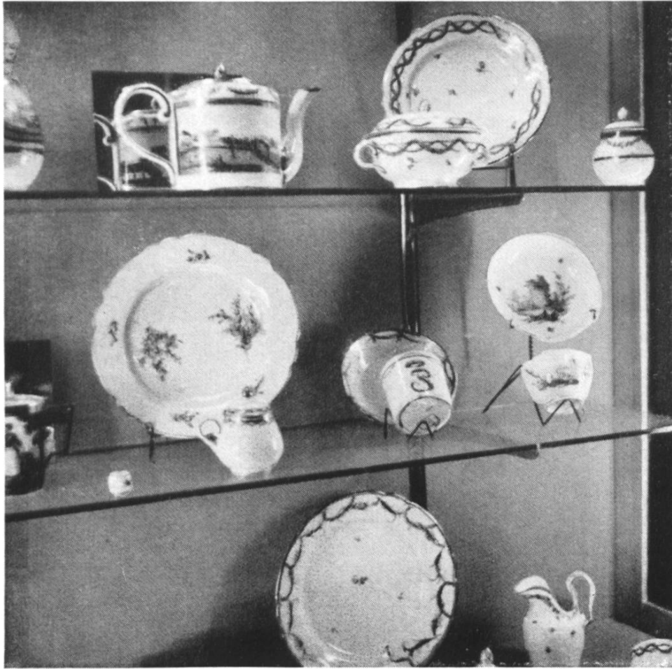
Fig. 17. Musée de Nyon. Un coin des vitrines de porcelaine de Nyon.

Le musée étant installé dans le château de Nyon (XII-XVI ème s.) il n'a pas toujours été possible de donner aux diverses collections une succession chronologique; pour ce motif, des étiquettes bien visibles précisent dans chaque vitrine la date de ce qui y est exposé; pour ne pas donner à ces belles salles médiévales l'aspect trop sec et trop froid d'un musée scientifique, on a d'une part adopté des couleurs lumineuses pour le mobilier d'exposition, d'autre part glissé ça et là des groupes pittoresques: costumes vaudois, meubles anciens du pays.