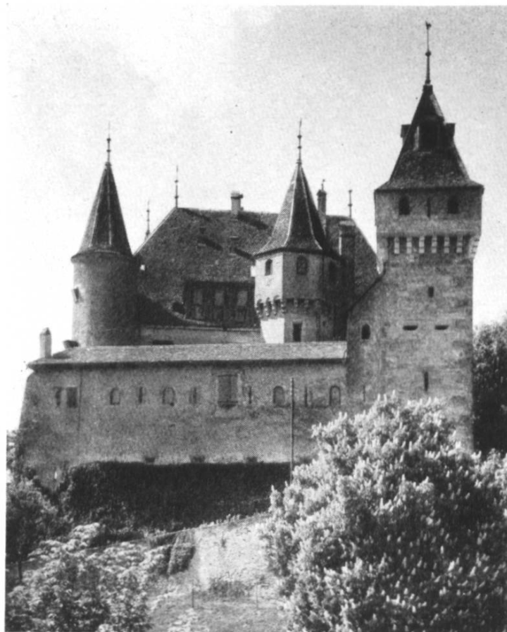
Fig. 18. Le château de Nyon, contenant le musée archéologique et historique.

Nyon possède sans doute le premier musée régional d'archéologie et d'histoire aménagé selon un programme strict et des méthodes nouvelles. C'est pourquoi l'on a fait l'honneur à ce petit musée de parler beaucoup de lui. Que nos lecteurs ne s'attendent cependant pas à découvrir à Nyon de vastes collections, quelque chose de massif et d'imposant; ils seraient déçus! Il faut visiter le musée de Nyon par un beau jour d'été; le château est charmant, la vue sur le Léman est des plus délicieuses; ce cadre embellit un musée qui se vante de vivre sans subsides officiels et sans fortune et qui, malgré ces inconvénients matériels, tente une formule nouvelle.