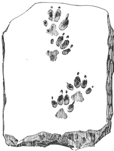
Abb. 39. Salet. Ziegelfragment mit Hundspfoten, rechts natürl. Grösse.

Beim Ausgrabungskurse 1946 des Institutes für Ur- und Frühgeschichte der Schweiz (U.-S. 1946, 42) fanden sich im Salet bei Wagen unter den sehr vielen Leistenziegelfragmenten auch einige mit Abdrücken. Die Tierspur ist die Fährte eines Haushundes. Der Abdruck des Menschenfusses weist darauf hin, dass ein Kind über die frischausgelegten Lehmziegel ging. Die Hand-