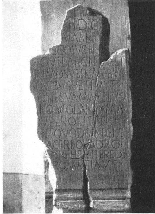
Fig. 37. Riva S. Vitale. Stele romana.

Nella riga ci sta solo o il nome della „tribus“ o quello del „cognomen“ ed è quindi lecito supporre tanto l'uno quanto l'altro. Troviamo infatti a Como: