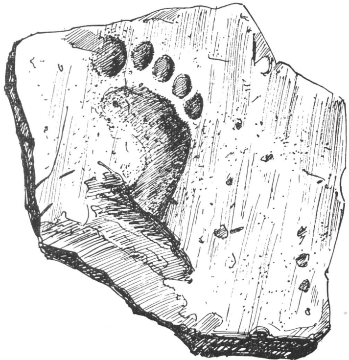
Abb. 41. Salet. Ziegelfragment mit Kinderfuss, 1:2.