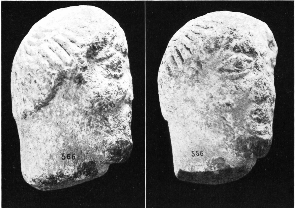
Fig. 26. Nyon. Tête virile, au Musée de Nyon.