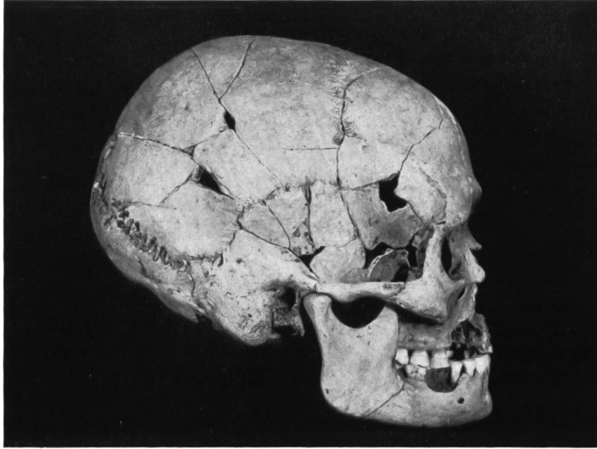
Abb. 23. Schädel des mesolithischen Jägers aus dem Birstal. Leihgabe von C. Lüdin, Basel. Naturhistorisches Museum Bern.

jetzt gefundene Berner», der natürlich in einer Jubiläumsausstellung zur 600-Jahrfeier nicht fehlen darf.