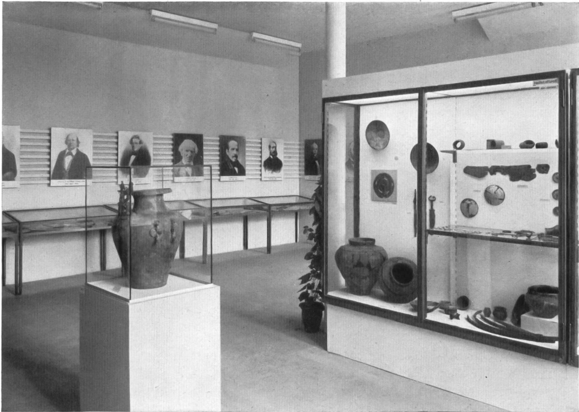
Abb. 21. Blick in die Ausstellung «Berner Altertumsforscher des 19. Jahrhunderts und wichtige vor- und frühgeschichtliche Funde aus dem Kanton Bern» im Historischen Museum.

Schließlich sei noch eine Gruppe bernischer Altertumsforscher ganz besonderer Art genannt: die Offiziere des vierten Schweizerregimentes (v. Wyttenbach) in neapolitanischen Diensten, die unserer Stadt 1830 eine äußerst wertvolle Sammlung griechischer und unteritalischer Gefäße zum Geschenk gemacht haben. Der Initiator dieser «Nola-Sammlung» war Hauptmann G. F. Heilmann von Biel (1785–1862). Außer einer Auslese der besten Stücke konnten hier auch die zugehörigen Dokumente ausgestellt werden.