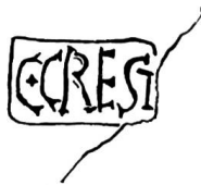
Fig. 12. Nyon, timbre du potier C. Crestius. Gr. nat.