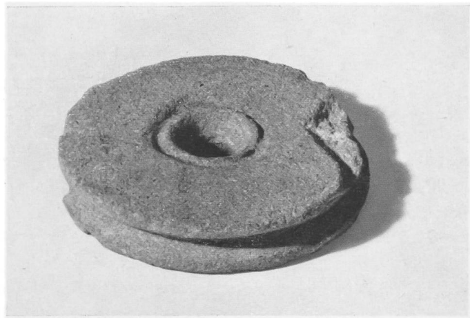
Abb. 14. Baldegg. Drillrädchen aus Sandstein. (Natürliche Größe).

Die in unserer Steinzeitwerkstätte durchgeführten Versuche lehrten uns, daß es zwei Möglichkeiten für die Herstellung dieser kleinen Bohrlöcher in den Schmucksteinen gibt: