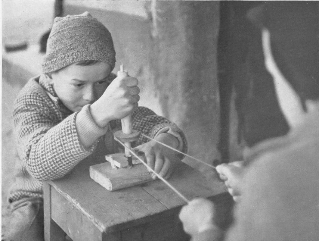
Abb. 15. In der neolithischen Werkstatt Seengen: Bohrversuch.

Bohrloch befinden mußte. Dieses Brettchen muß ebenfalls mit Holzzäpfchen befestigt werden, um das Herumrutschen auf dem Schmuckstein zu vermeiden. Das Bohrloch im Brettchen wird mit feinem Quarzsand angefüllt, der von Zeit zu Zeit erneuert werden muß. Die Einkerbung am äußeren Rande des Schwungrädchens dient nun als Führung für die Schnur, die – wie es das Bild zeigt – von Hand in Drillbewegung gesetzt wird. Es kann aber auch die Sehne eines Bogens verwendet werden. Diese Arbeit läßt sich dann von einer einzigen Person ausführen, die mit der linken Hand den Holunderstab hält und mit der rechten den Bogen betätigt. Mit der beschriebenen Bohrung, die nach unseren Erfahrungen