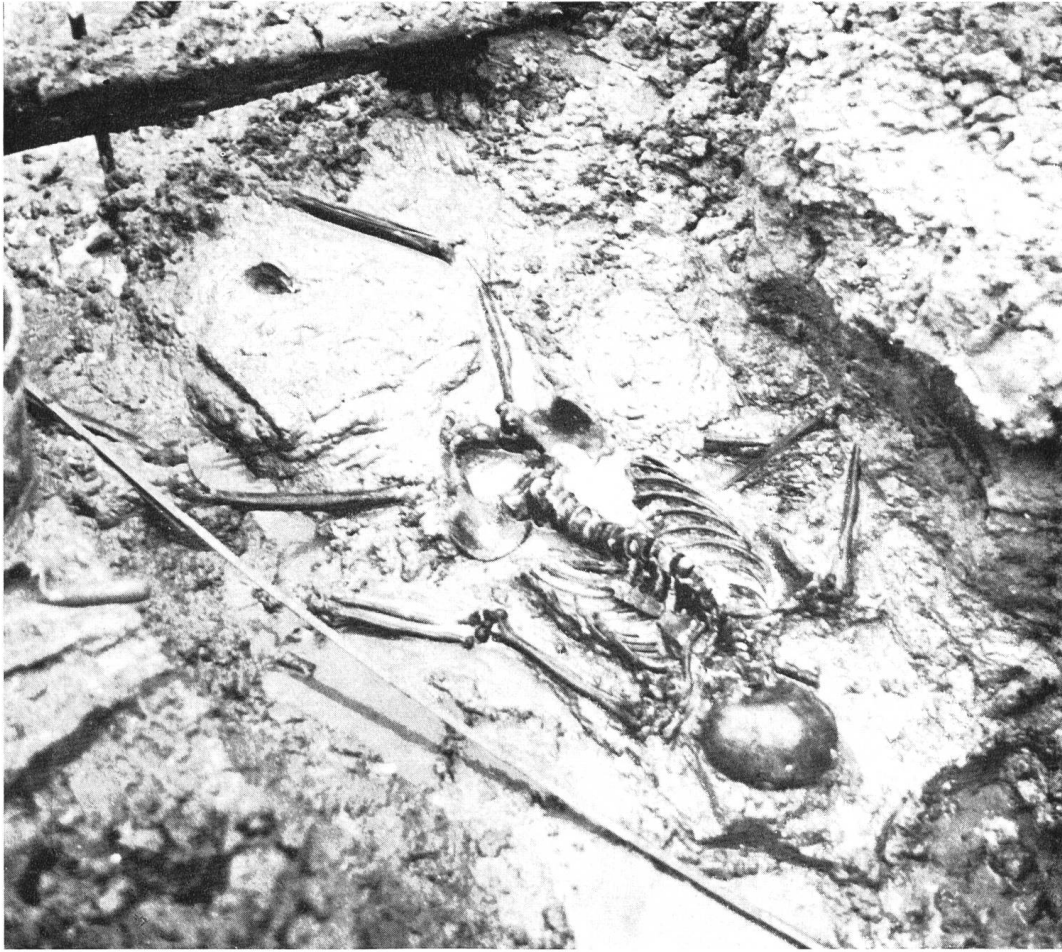
Abb. 6. Cornaux, NE. Keltisches Skelett.