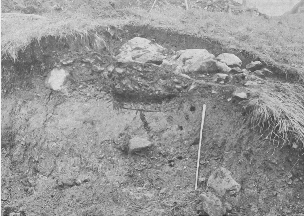
Abb. 52. Buochs NW. Schnitt durch Grab 1. Die schweren Steine sind keine Grabbedeckung, sondern stammen von Ausbrüchen des Dorfbaches. Die horizontale untere Begrenzung der Grube kann von einer teilweisen Verschalung mit Brettern stammen.

Grabungstage mit Studenten der Universität Bern ermöglichten es, drei Brandgräber freizulegen, die unter einer durchschnittlich 70 cm mächtigen Schicht von Wildbachgeschiebe und Humus lagen (Koordinaten 674 853/202 619 492,70 m ü. M.) (Abb. 53).