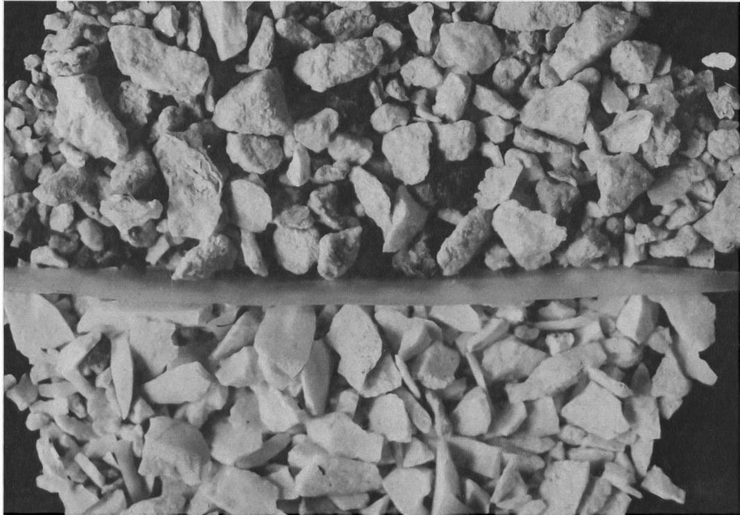
Abb. 51. Löwenburg (Pleigne BE). Aus dem Abraam ausgeschlammter Splitt von 0,5–2 mm Korngröße. Die Kalkstückchen oben sind genau so scharfkantig wie die Silexstückchen unten. Gr. 10:1.

lassen und zu konservieren, damit er als Kulturdenkmal der Forschung und dem interessierten Wanderer sichtbar bleibt.